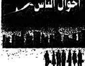
ممرضون يمدونون يداهم في مستشفى في غزة، على يد طاقم إغاثة الصليب الأحمر.

سجناء كيب مسلحين فلسطينيين داخل سجن حيفا، حيث تم اعتقالهم بعد أحداث الانتفاضة الثانية.